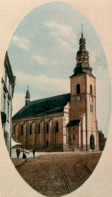
Myslowitz O.-S. — Alte Kirche